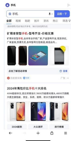
搜索“手机”的结果示意

2、广告位业务：公司将欧朋浏览器等应用上的广告位提供给今日头条、腾讯等拥有网络广告联盟的互联网客户用于展示广告，并按照约定的计费方式（如展示时长、次数，或推广产品的激活量、点击数、销售额等）收取广告服务费。