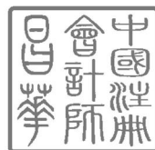
中国注册会计师：昌 华 （项目合伙人）