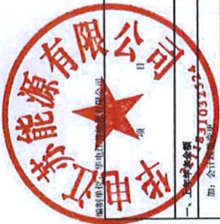
母公司所有者权益变动表 2024年度