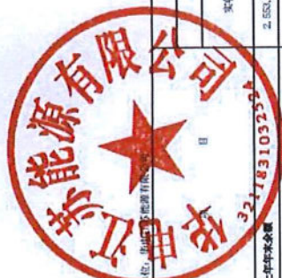
合并所有者权益变动表（续）