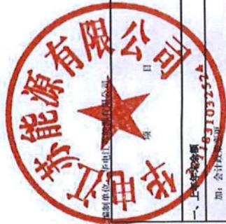
母公司所有者权益变动表（续）