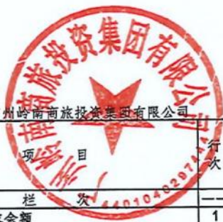
合并所有者权益变动表