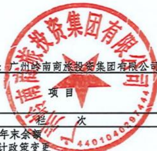
公司所有者权益变动表